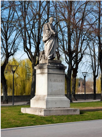
Henri Dumaige, monument à Rabelais, marbre sur socle de pierre, 1880, Tours (Indre-et-Loire).

Le service Patrimoine et Inventaire de la Région Centre-Val de Loire a étudié, de 2010 à 2013, 186 monuments et 25 fontaines érigés entre 1800 et 1945 et publié en 2015 une synthèse de cette étude régionale. La présente exposition porte sur les monuments élevés à la mémoire des grands hommes, qui constituent plus de 120 monuments.